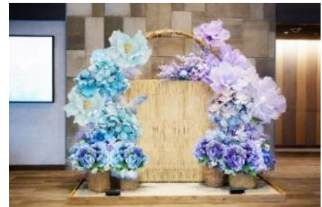
廃シーツを活用した紫陽花のフォトスポットが登場

◎本件に関する報道各位からのお問合せ 軽井沢プリンスホテル ウェスト 広報担当 TEL:0267-42-8115(セールス&マーケティング直通) FAX:0267-42-8118 https://www.princehotels.co.jp/karuizawa-area/