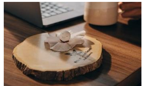
全客室でてるてる坊主がお出迎え