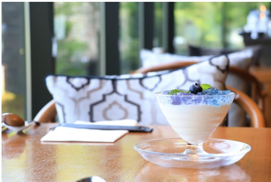
紫陽花をイメージした「紫陽花杏仁豆腐」のデザート