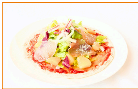
マンゴーと生ハムの サラダピザ