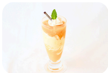
ちいさなマンゴーパフェ ＜マンゴー1/2個使用＞