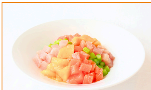
マンゴーと海の幸の 彩りポキボウル