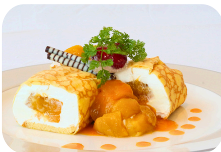
マンゴ어의贅沢クレープ ＜マンゴー1個使用＞