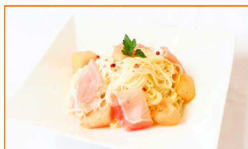
マンゴーとバジル風味の カッペリーニ