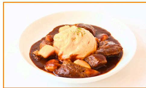
マンゴーとごろごろビーフの シチューオムライス