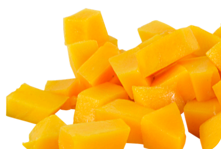
マンゴーぷらすトッピング ＜マンゴー1/2個使用＞