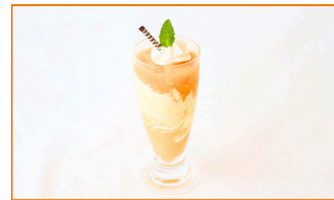
ちいさなマンゴーパーフェ