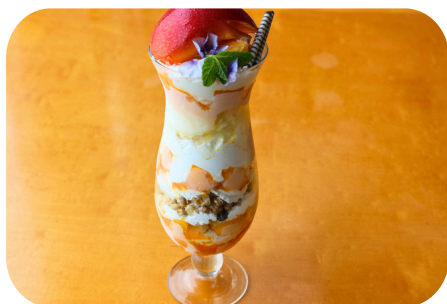
サンライズマンゴーパフェ ＜マンゴー1個使用・高さ約30cm＞