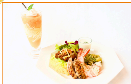
トロピカルカフェプレート マンゴードリンクとスイーツ付き