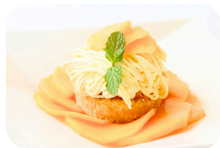
至福のマンゴーモンブラン ＜マンゴー1/2個使用＞