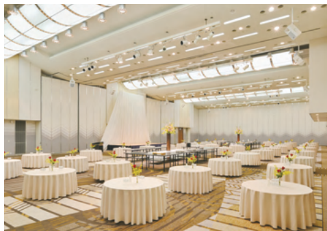
コンベンションホール「淡海」