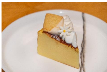
Basque Cheese Cake バスクチーズケーキ