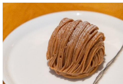
Mont Blanc モンブラン