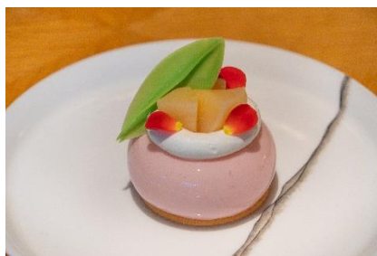
Peach Mousse Cake 桃のムースケーキ