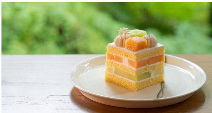
Melon Sponge Cake 国産メロンのショートケーキ