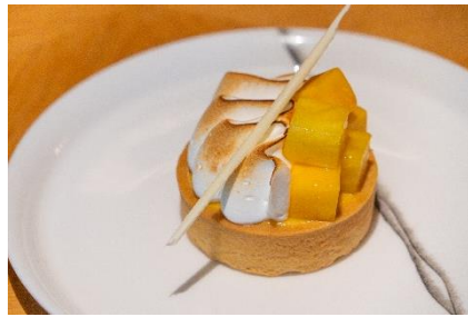
Tropical Fruit Tart トロピカルフルーツタルト