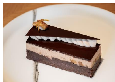
Chocolate Orange Cake ショコラオレンジ