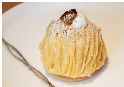
Mont Blanc モンブラン