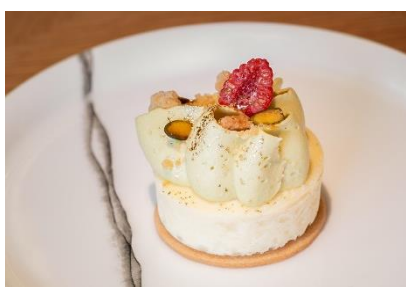
Pistachio Cheese Cake フロマージュ ピスタチオ