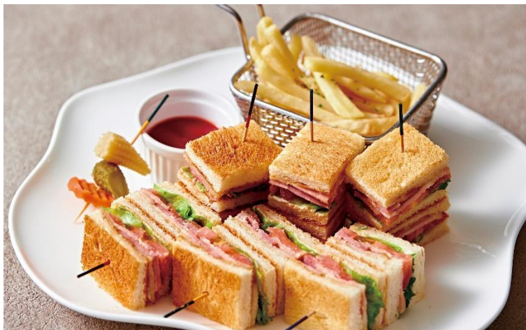
BLT サンドウィッチ B.L.T Sandwich