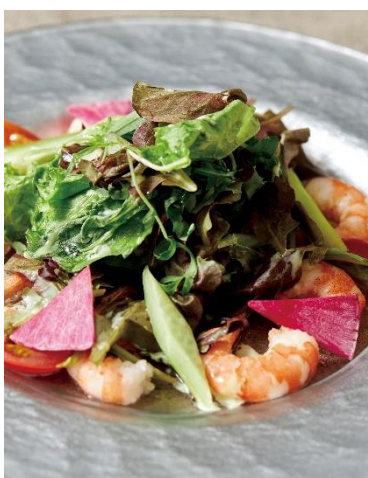
小海老のサラダ仕立て Shrimp Salad

* 表記料金には、消費税が含まれております。別途13%のサービス料を加算させていただきます。* 写真はイメージです。 * Prices includes consumption tax. An additional 13% will be added for service charge. * Actual presentation may differ from what you see in the photos.