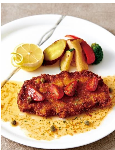
ウィーン風 仔牛のカツレツ Wiener Schnitzel

* 表記料金には、消費税が含まれております。別途13%のサービス料を加算させていただきます。* 写真はイメージです。 * Prices includes consumption tax. An additional 13% will be added for service charge. * Actual presentation may differ from what you see in the photos.