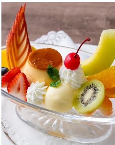
プリンアラモード Pudding a la mode