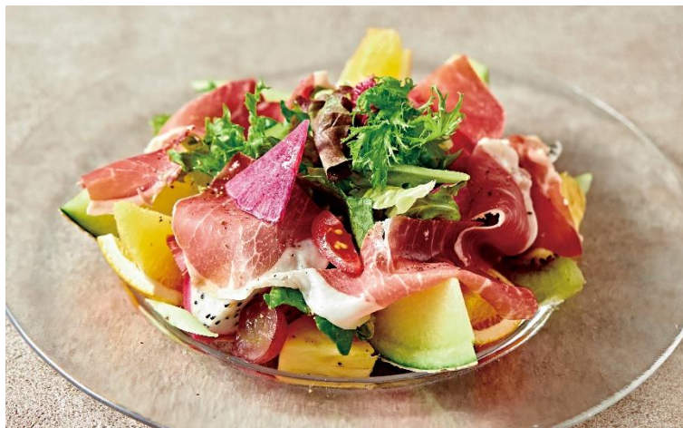
生ハムのフルーツ添え Fresh Ham with Fruits