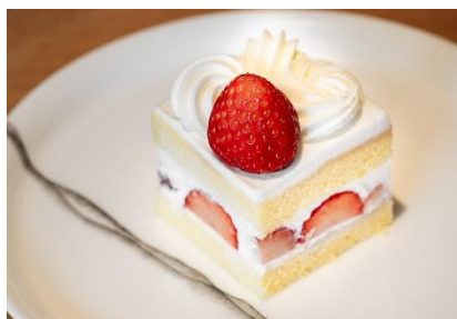
Strawberry Sponge Cake いちごのショートケーキ