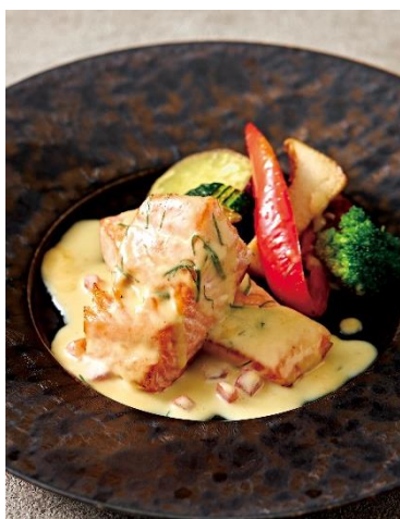
サーモンステーキ オゼイユのクリームソース Sautéed Salmon, Sorrel and Cream Sauce