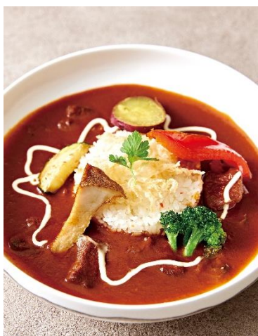
ビーフストロガノフ バターライス添え Beef Stroganoff with Butter Rice