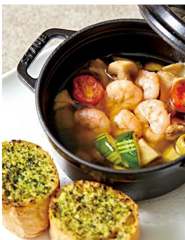
海老と帆立のアヒージョ Spanish-Style Garlic Shrimp and Scallop