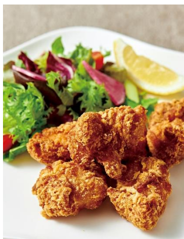
フライドチキン Fried Chicken