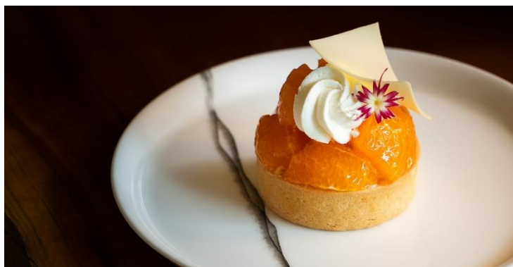
Sumo Citrus Tart デコポンのタルト