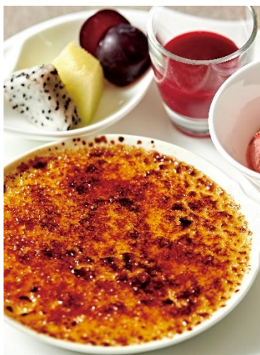
クレームブリュレ Crème brûlée

*表記料金には、消費税が含まれております。別途13%のサービス料を加算させていただきます。*写真はイメージです。